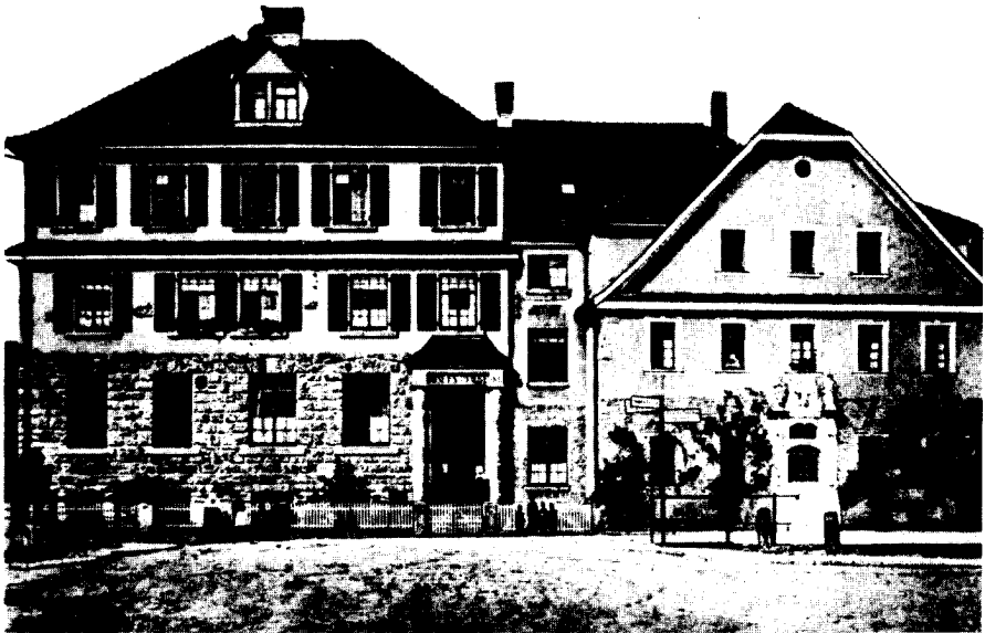
Die St. Josefspflege in Muldingen.

Vor zehn Jahren wußte ich über die Zigeunerverfolgung im NS-Staat genauso wenig wie die meisten Mitbürger noch heute. Mein Interessengebiet ist die Geschichte des Jugendrechts. Bei der Durchsicht älterer Literatur 1 fand ich einen Hinweis auf den Erlaß des Württembergischen Innenministers vom 7. November 1938. Er hatte eine Neuordnung des Zöglingsbestandes in den württembergischen Kinder- und Erziehungsheimen zur Folge. Nach der Neuordnung sollten u. a. die schulpflichtigen »Zigeunerkinder« und die »zigeunerähnlichen Kinder« aus den verschiedenen Heimen herausgenommen und in einem besonderen Heim zusammengefaßt werden: »Die Zuweisung jedes Zöglings zu den einzelnen Gruppen erfolgt hier auf Grund eines Gutachtens des Landesjugendarztes, der hauptamtlich im Landesjugendamt tätig ist.«