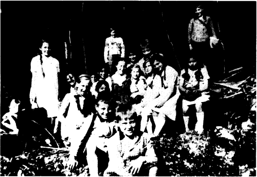
Mulfinger Heimkinder. Um 1941. (Aus der Erinnerungsmappe der Lehrerin J. Nägele)

durfte man in der Fürsorgeerziehungsbehörde nicht erwarten, daß die St. Josefspflege derartigen Gedankengängen folgte. In ihrer Not erfuhren gerade die »Zigeunerkinder« die besondere Zuwendung der Betreuerinnen. Die Schwestern und die Lehrerin trugen die Sorgen dieser Kinder mit, die völlig gleichberechtigt in der Heimgemeinschaft lebten.