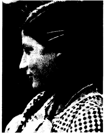
(Aus: Eva Justin: Lebenschicksale S. 53)

Natürlichkeit und Harmonie ganz verschließen zu können. Da hatte das Kind die Zuschauer gesehen, errötete, das Gesicht spannte sich abweisend, und sie tanzte nun unbeteiligt und fast linkisch weiter.«