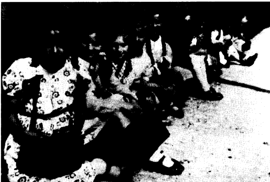
Ausflug der Mulfinger Heimkinder. Um 1941.