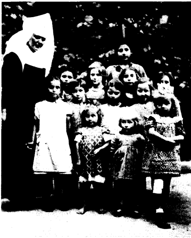
Die »Zigeunerkinder« lebten in der Gemeinschaft des Kinderheimes.

Nach Überwindung einer bürokratischen Hürde erhielt ich diesen sogenannten »Heimerlaß«, der besagt, daß die »Zigeunerkinder« in die St. Josefspflege Muldingen (Hohenlohekreis) eingewiesen wurden. Darauf ergab sich die Frage: Wie wurden diese Kinder pädagogisch betreut, wie mag es mit ihnen weitergegangen sein?