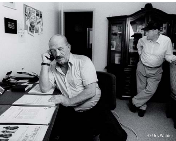
Alltag im jenischen Hauptquartier, Neunzigerjahre.