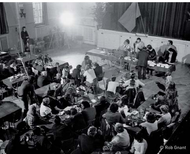
Gründung der Radgenossenschaft, 1975.