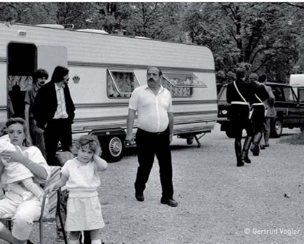
Fahrende besetzen den Luzerner Lido, 1985.